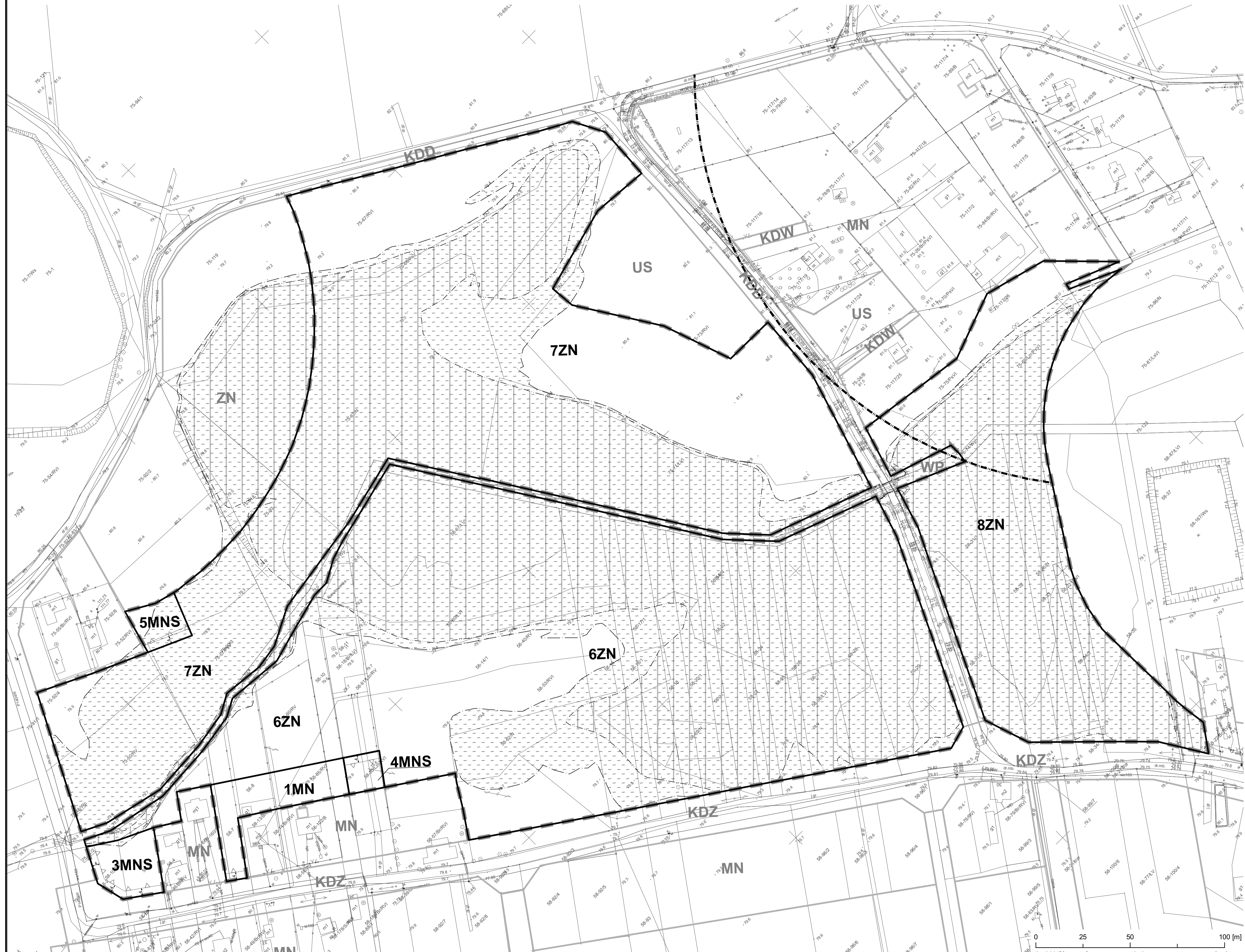
Wzrys ze Studium uwarunkowań i kierunków zagospodarowania przestrzennego gminy Gostynin

Załącznik Nr 2 do Uchwały Nr 556/LI/2023 Rady Gminy Gostynin z dnia 29 września 2023 r.