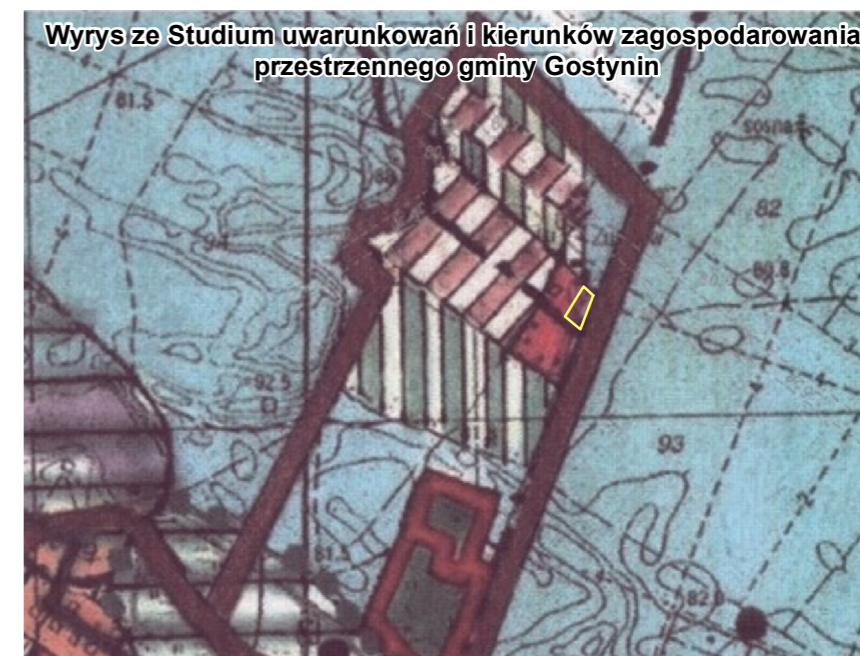
Wyrys ze Studium uwarunkowań i kierunków zagospodarowania przestrzennego gminy Gostynin

granice terenu objętego zmianą planu OBSZARY PRZEKSZTAŁCEN I INTENSYFIKACJI ISTNIEJĄCYCH UKŁADÓW OSADNICZYCH wg DOMINUJĄCEJ FUNKCJI: ZABUDOWY LETNISKOWEJ I TURYSTYCZNEJ