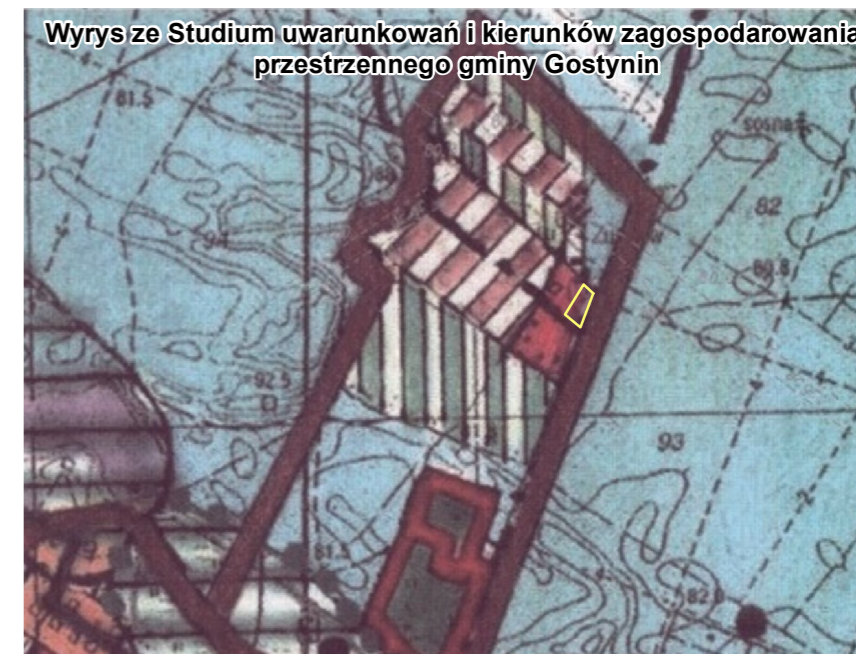
granice terenu objętego zmianą planu OBSZARY PRZEKSZTAŁCEN I INTENSYFIKACJI ISTNIEJĄCYCH UKŁADÓW OSADNICZYCH wg DOMINUJĄCEJ FUNKCJI: ZABUDOWY LETNISKOWEJ I TURYSTYCZNEJ